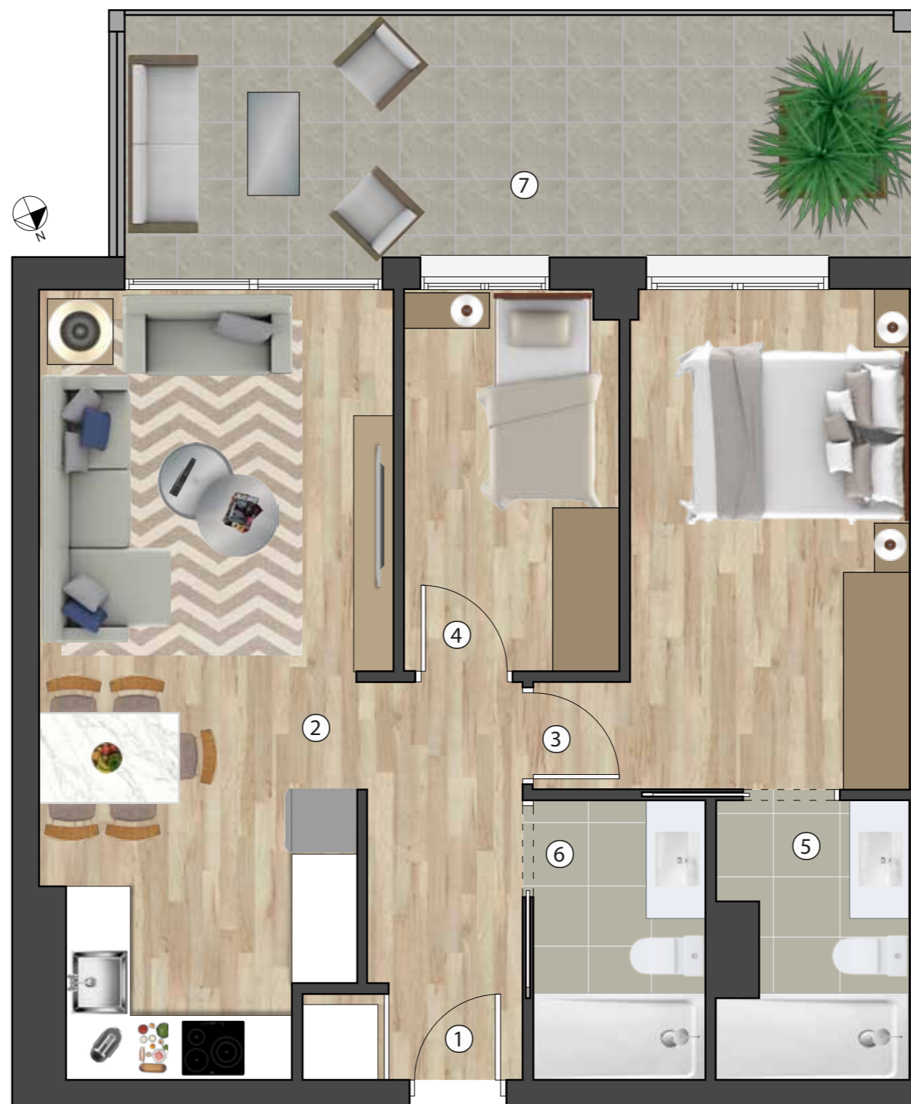
Pl. 1 - F