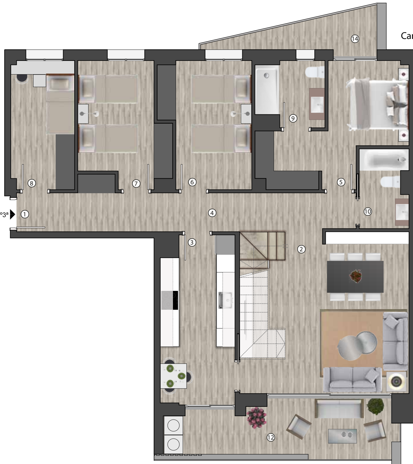
Carrer Ramon Rubial