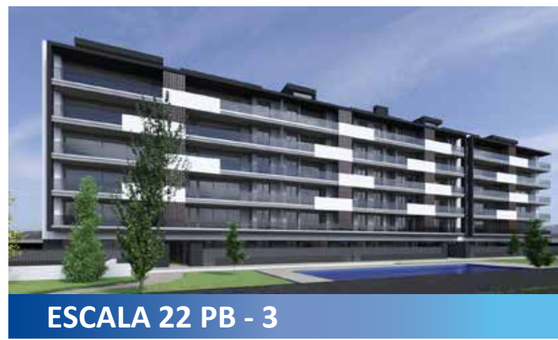
ESCALA 22 PB - 3