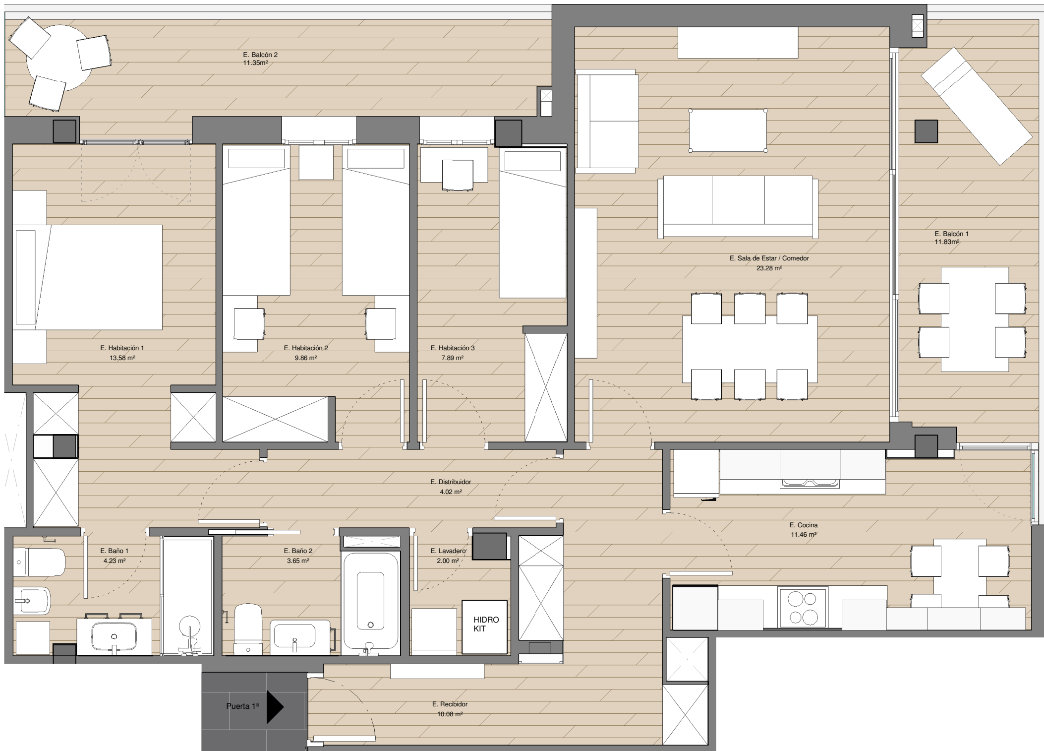
PLANTA PRIMERA PUERTA PRIMERA

LAS CARACTERÍSTICAS DE LA VIVIENDA Y LAS INSTALACIONES ESTARÁN SUJETAS A LAS EXIGENCIAS DE LAS NORMATIVAS VIGENTES, ASÍ COMO EN LAS SOLUCIONES TÉCNICAS DETERMINADAS POR LA DIRECCIÓN FACULTATIVA. PLANO DE PROYECTO SUJETO A MODIFICACIONES EN OBRA Y A CRITERIO DE LA DIRECCIÓN FACULTATIVA. LAS SUPERFICIES DEFINITIVAS, SERÁN LAS RESULTANTES DE LA EJECUCIÓN EN LA OBRA.